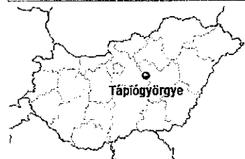
Pozíció Magyarország térképén