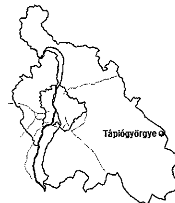
Pozíció Pest megye térképén